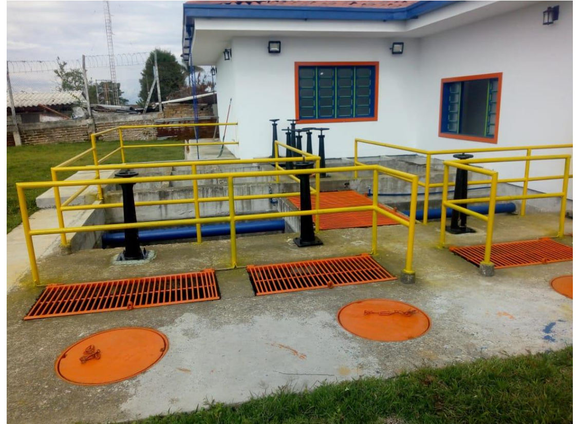
Planta de Tratamiento de Belalcázar

La Empresa de Obras Sanitarias de Caldas “EMPOCALDAS S.A E.S.P” es una Sociedad Anónima Comercial de Nacionalidad Colombiana, del orden Departamental, clasificada como empresa de servicios públicos, con autonomía administrativa, patrimonial y presupuestal, que se rige por lo dispuesto en la Ley 142 de 1994 y la Ley 689 de 2001.